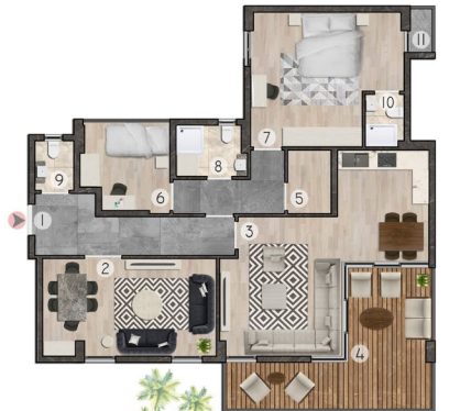
3+1 ZEMİN DAİRE PLAN: 135 m 2