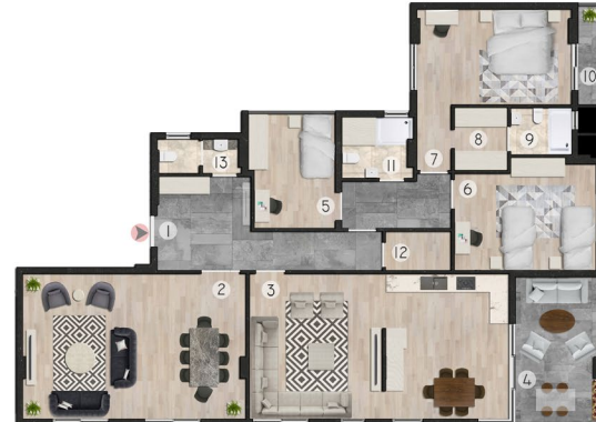
4+1 DAİRE PLAN: 200 m 2 (AÇIK MUTFAKLI)