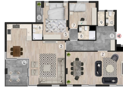
3+1 DAİRE PLAN: 150 m 2